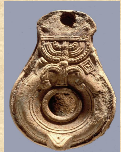
נר בית נטיף, מאות 3 עד ה-5 לספירה עם מגורת שבעת הקנים. Gardner 2014, 287, fig. 4.

כגון מגורת שבעת הקנים, ואף בסמלים נוצריים, כגון דג האיקטוס. בית מלאכה נוסף נחשף בשנת 2014 בחפירת שומיילה, קילומטר צפונית-מערבית לבית נטיף, שם התגלו יותר מ-600 שברי נרות וחמש עשרה תבניות דפוס מאבן. נרות שמן מצורת בית נטיף התגלו בתוך מערות קבורה רבות מה שמעיד על סגולותיהם הפולחניות.