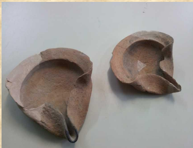
נר מקופל מהתקופה הפרסית.

נרות שמן הינם חלק ממכלול הכלים העשיר שהעולם העתיק השאיר מאחוריו. בשל גודלם הקטן, רבים השתמרו בצורה מצוינת והותירו מורשת תרבותית עמוקה ומלאת ידע. עד התקופה הפרסית, נדחקו הנרות לשולי הייצור, אך עם כניסת השפעת ההלניזם, סגנונם וצורתם הפכו למורכבים ומעוטרים. בד בבד, הפך הנר לסממן אתני והיווה עבור הדתות המונותאיסטיות לסמל קדושה.