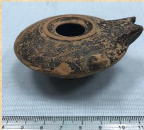
נר הלניסטי על דפוס.

לאורך תקופות הברונזה והברזל, ייצור הנר בארץ ישראל היה למטלה פשוטה למדי. הקדר עיצב קערה קטנה, ידנית או על האובניים, וקיפל קצה אחד שלה. הקיפול יצר פתח צר, אליו שולשל הפתיל, ופתח רחב, שלתוכו נשפך השמן. טיפוס זה מכונה נר פתוח והיה לנפוץ ביותר עד התקופה הפרסית. כבר בתחילת המאה ה-4 לפסה"נ,