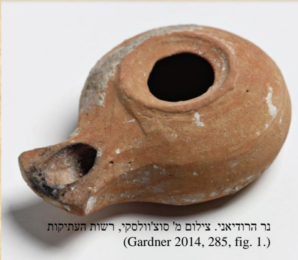
נר הרודיאני. (Gardner 2014, 285, fig. 1.)

נר השמן הפך לייצוג מוחשי של האור האלוהי. עד מרד בר כוכבא, בשנת 135 לספירה, האוכלוסייה היהודית בארץ השתמשה בעיקר בנרות הרודיאניים עשויים אובניים, בעלי זרבובית פרוסה וחסרי כל עיטור. יש הטוענים שקיצוץ הזרבובית נעשה על מנת לשמור על חוקי טהרה מסוימים. בני זמנם של הנרות ההרודיאניים היו נרות הדיסקוס הרומיים. הנרות המעוטרים הללו, נבדלו מקודמיהם ההלניסטים בחלקם העליון, עליו יוצקים את השמן. לנר הרומי לא היה פתח עגול ורחב, הוא התהדר בדיסקוס קעור עם מוטיב דקורטיבי וחור