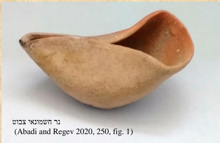
נר חשמונאי צבוט (Abadi and Regev 2020, 250, fig. 1)

לנר הפתוח. ניתן אפוא להתייחס להופעת הנר החשמונאי כהחלטה תרבותית שאותה קיבלו היהודים כדי להיבדל משכניהם הגויים, וככלי של תנועת מרד המכבים לקבלת לגיטימציה עממית באמצעות שימוש בזיכרון קולקטיבי. נרות חשמונאיים, החזיקו מעמד רק עד אמצע המאה ה-1 לפסה"נ, ועם נפילת השושלת ותחילת השפעתם של רומא והורדוס, נכנסו במהרה סוגים חדשים של נרות סגורים עשוי